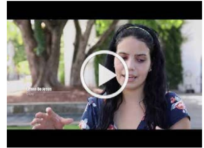
Sabias Que El Impuesto a Inventarios es un Desastre?