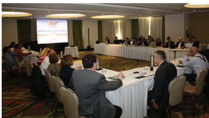
Una Mirada al salon donde se celebró la reunión.