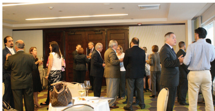
Foto derecha: Luego de la reunión los empresarios disfrutaron de un cóctel y networking.

De igual manera, el empresario indicó que al enfocar las actividades de los comités en esos dos temas eso incidirá en tres de las áreas que deben trabajar: rentabilidad, retención y reclutamiento. No obstante, explicó que las mismas deben ser realizables, rentables, relevantes y resonantes para que ayude a fortalecer la marca e imagen de la organización. ★